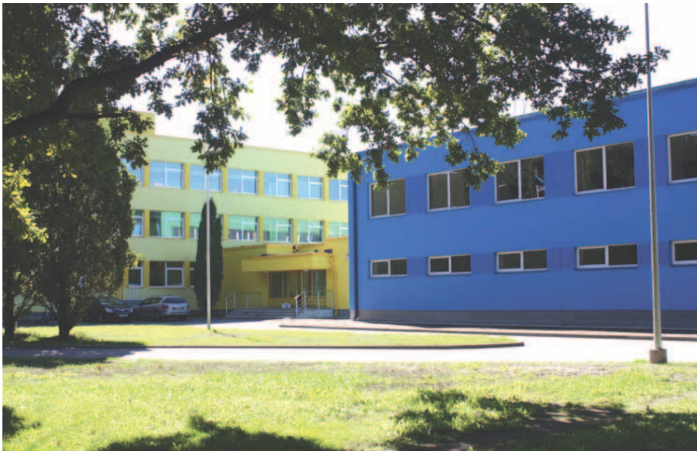
Kostivere kooli, raamatukogu ja perearstikeskuse ehitus.

Täna volikogu koosseisuga viimane istung toimub 17.10. email: artkuum@hotmail.com telefon: 501 7127 skype: art.kuum