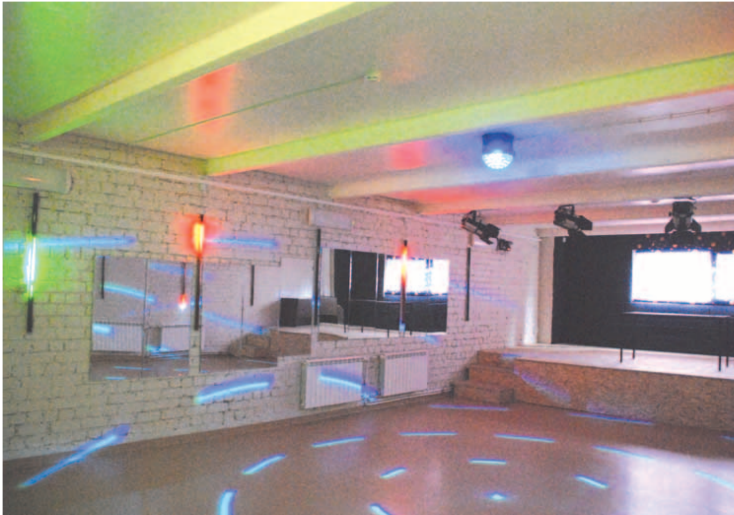
Effektvalgustitega ruumis saab korraldada kohalike noorte seas populaarseid diskoõhtuid. Päeval treenivad noortekeskuse renoveeritud saalis Kostivere ergutusgrupi tantsutüdrukud.