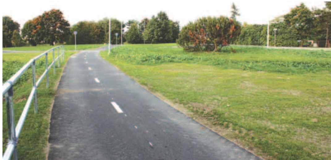
Loo-Lagedi kergliiklustee ja tänavavalgustuse ehitamine.

Tulles tagasi kääride juurde, siis viimase paari nädala sees on meil olnud hea võimalus need mõlemad objektid pidulikult avada ning anda need ka ametlikult nende eesmärgipärasusse kasutusse.