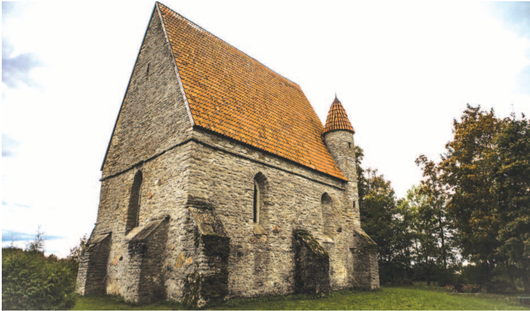
Keskaja mõistes täiesti enneolematu suurusega Saha kabeli põnev minevik paelub ajaloolasi veel tänapäevalgi.

Järgnevalt tõuseb Saha kirik ajaloos esile seoses Taani hindamisraamatuga, mis pandi kirja aastal 1241, juba pärast Põhja-Eesti vallutamist taanlaste poolt. Nimetatud teos sisaldab Taani valduses olnud külade nimestikku ning nende algset (muinas) kihelkondlikku kuuluvust, uut kirikukihelkondlikku