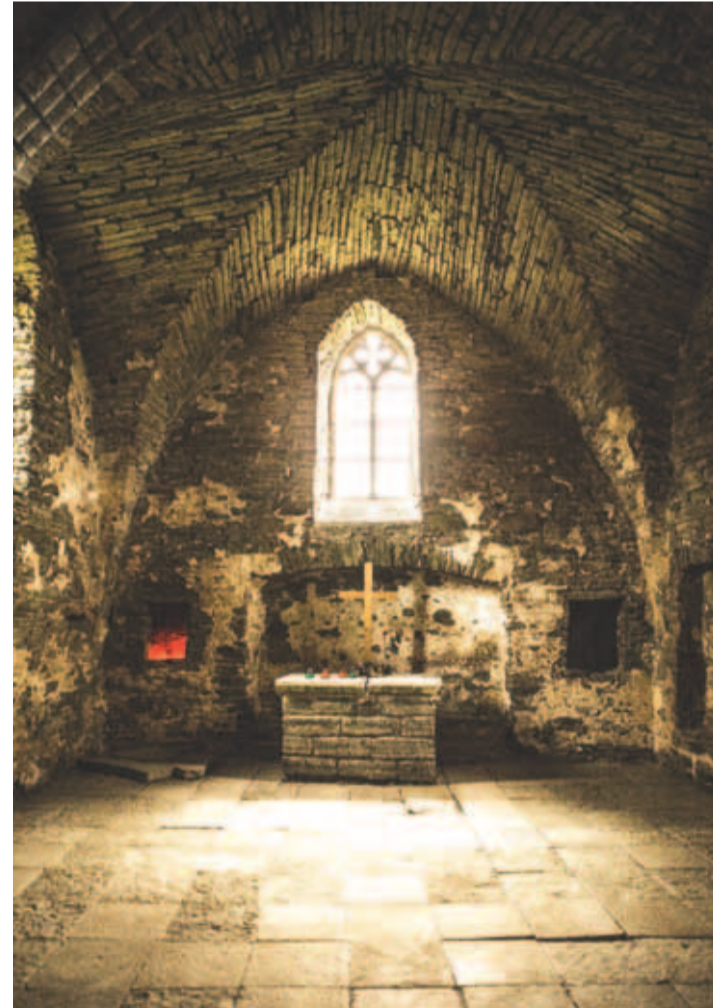
Kunagistele kabeli ehitajatele ei olnud geomeetiline korrektsus eriti tähtis. Selleks, et järele mõelda, mis on tähtis, on Saha kabel üks hea koht.

Igal juhul toimus Pirita kloostris rajamisega teatav Skandinaaviapoolse kirikumõju tõus ja selle tähtsustamine esimese