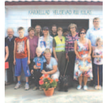
Ruu küla bussipeatus