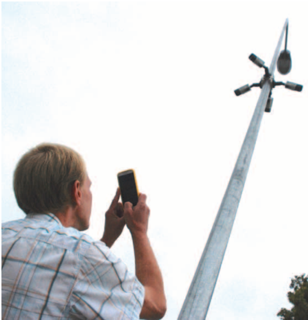
Kaamerate paigaldaja Kurmutec Systems OÜ kinnitusel jäädvustatakse selget pilti ka pimedas.